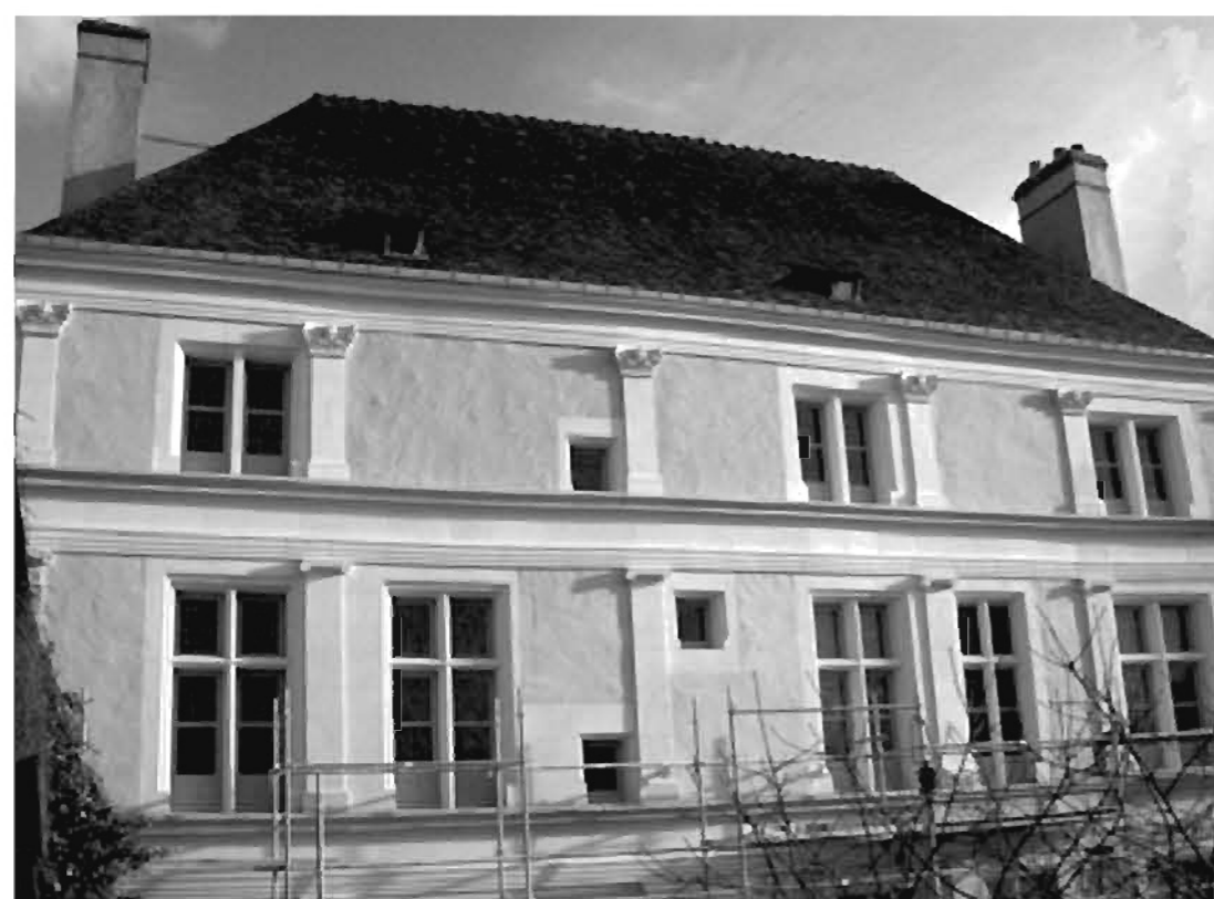
La façade arrière : Les échafaudages disparaissent progressivement : le premier et le second étage sont dégagés.

Plusieurs milliers de visiteurs ont découvert l'espace Jean de La Fontaine, du 1 er au 11 octobre 2010 à la Foire Internationale de Metz. La ville de Château-Thierry et le musée y occupaient une place importante. Ce fut un réel succès : Vous pourrez en avoir un aperçu sur la page d'accueil du site http://www.la-fontaine-ch-thierry.net (en cliquant sur video ).