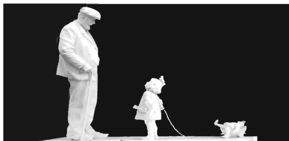
Carte postale, Salon de Paris - A E Jacopin - Grand-Père

2011 : année de la sculpture : les artistes à l'honneur.