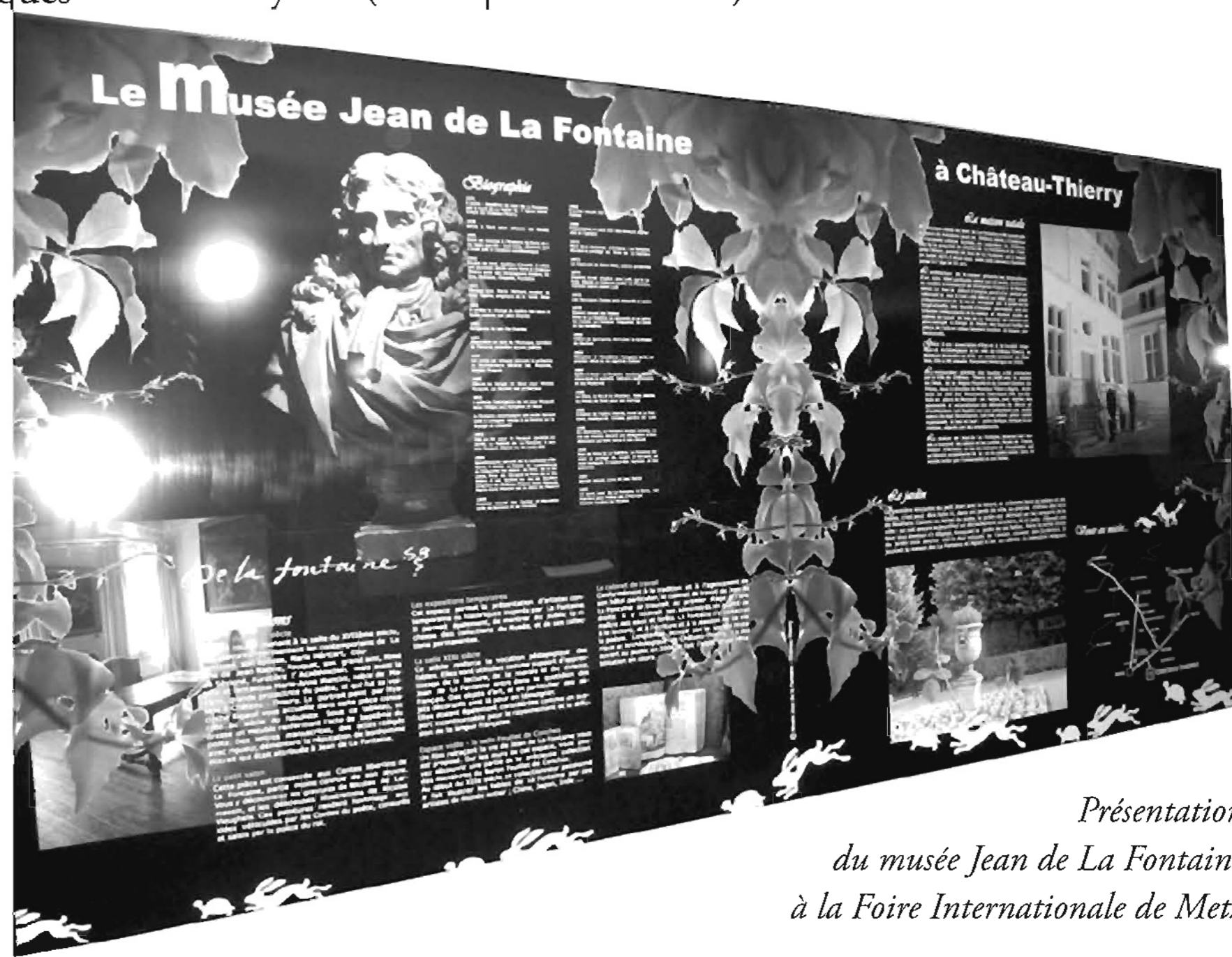
Présentation du musée Jean de La Fontaine à la Foire Internationale de Metz