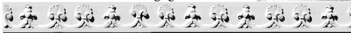
Frise florale au-dessus de la porte d'entrée de la maison natale-musée.